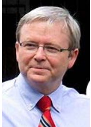
Prime Minister Kevin Rudd