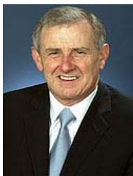
Trade Minister Simon Crean