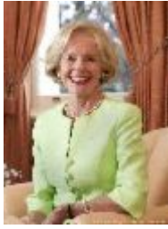
Governor General Quentin Bryce