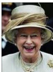
Queen of Australia

ฝ่ายบริหาร : ประมุขของรัฐ สมเด็จพระราชินีนาถเอลิซาเบธที่ 2 แห่งอังกฤษ (ตั้งแต่ 6